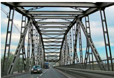
Piotr Rychlewski Most przez Wisłę w Grudziądzu