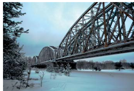
Sławomir Stańczyk Most kolejowy na Bugu we Fronołowie (3)