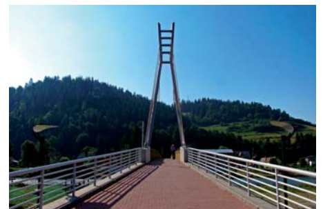
Piotr Rychlewski Kładka przez Dunajec w Sromowcach Niżnych (1)