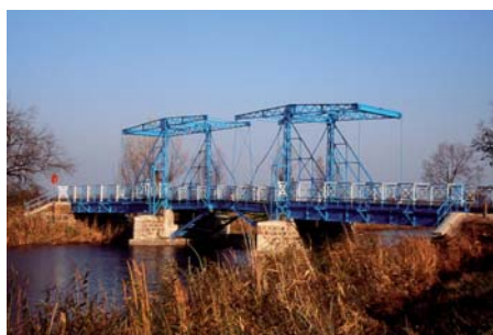
Most na rzece Tinie w miejscowości Jeziorze