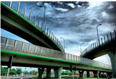
Andrzej Gebert Przed burzą