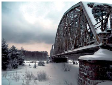
II nagroda – Sławomir Stańczyk Most kolejowy na Bugu we Fronołowie (2)