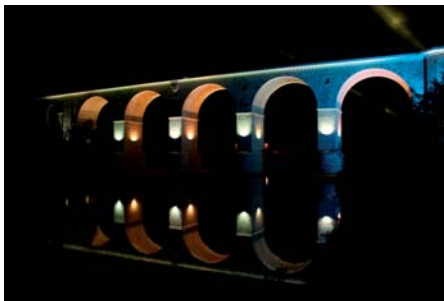
Władysław Kluczewski Wiadukt kolejowy w Bolesławcu