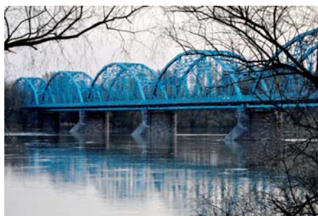
Mariusz Prędota Modlin – most im. Józefa Piłsudskiego nad Wisłą (2)