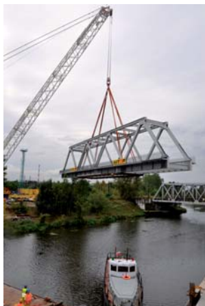
Mariusz Prędota Mosty kolejowe na linii E65 nad Kanalem Żerańskim w Warszawie (6)