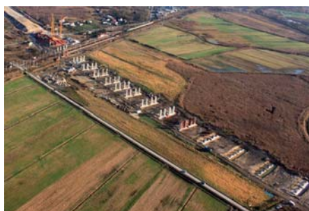
Władysław Kluczewski Budowa wiaduktu WA22 nad polderami na AOW