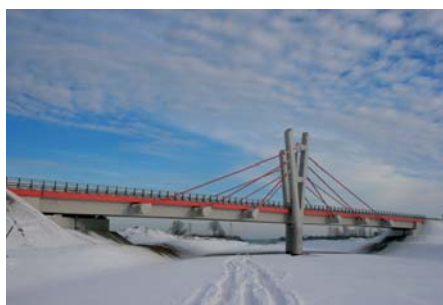
Władysław Kluczewski Wiadukt WD 22 na A4 zimą