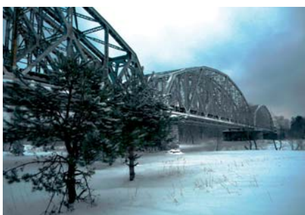
Sławomir Stańczyk Most kolejowy na Bugu we Fronolowie (1)