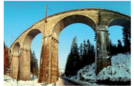
Piotr Rychlewski Most kolejowy przez potok Łabajów w Wiśle (2)