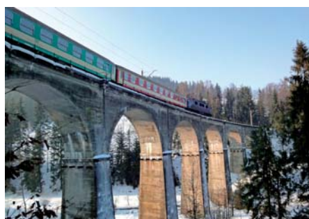
Piotr Rychlewski Most kolejowy przez potok Łabajów w Wiśle