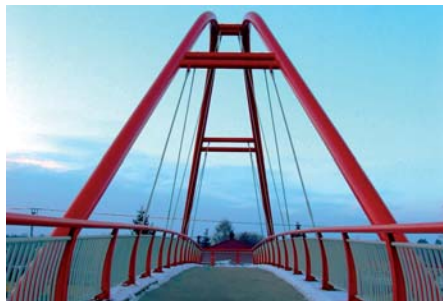
Czesław Prędota Jadwisin – kładka nad DK61 (3/4)