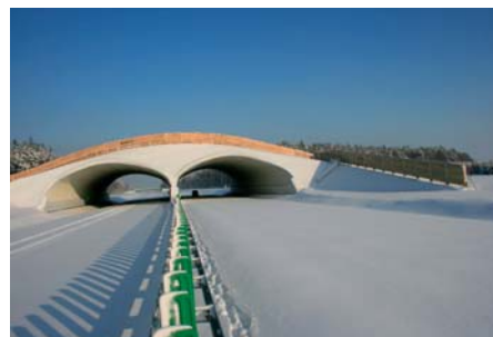
Władysław Kluczewski Przejście dla zwierząt PZ51 na A4 zimą