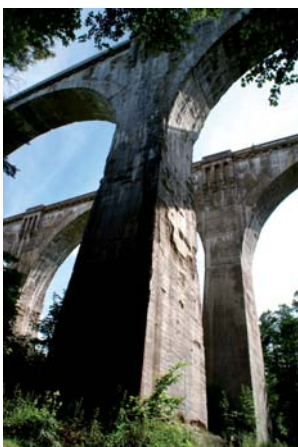
Stanisław Strug Fragment mostów w Stańczykach (2)