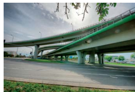
Andrzej Gebert Wszystkie drogi prowadzą do ...