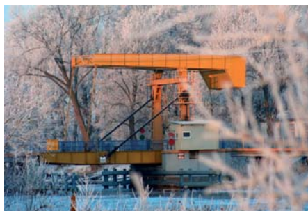
Piotr Sosnowski Most na rzece Szkarpa w miejscowości Rybina