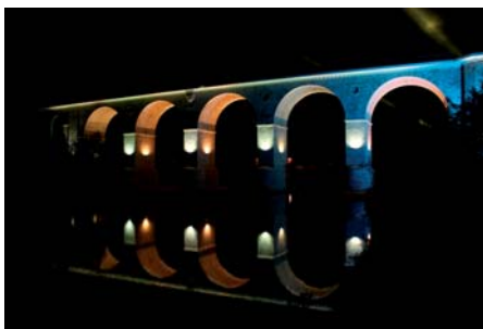
Władysław Kluczewski Wiadukt kolejowy w Bolesławcu