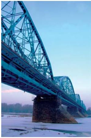
Modlin – most im. Józefa Piłsudskiego nad Wisłą (1)