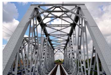
Mariusz Prędoła Wiadukt kolejowy na linii Warszawa – Terespol (9)