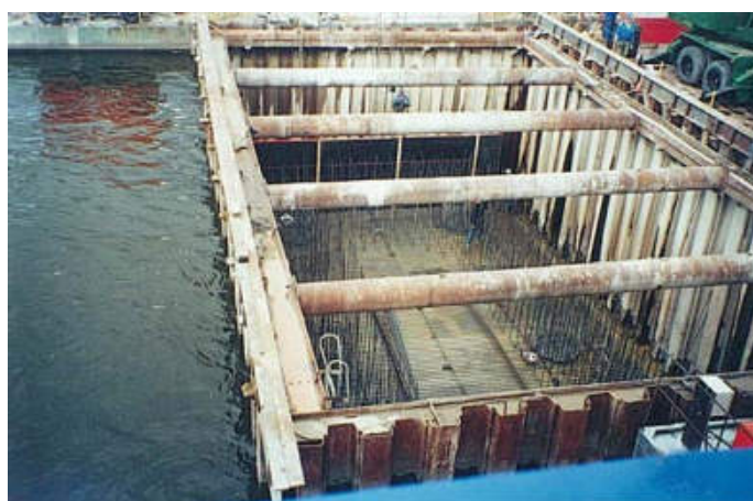
Zbrojenie fundamentu nr 3