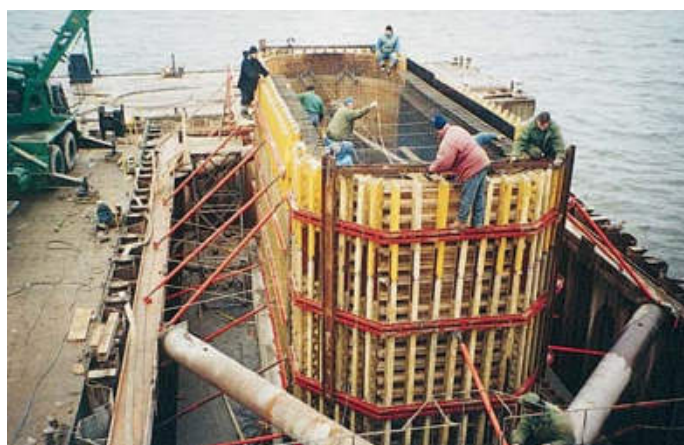
Deskowanie filara podpory nr 2

Projekt technologiczny w zakresie dotyczącym pływającej konstrukcji montażowej z 2 barek W-2 i rusztu stalowego, umożliwiającej doprowadzenie palownicy na miejsce budowanej podpory i przemieszczanie jej nad kolejno wykonywane pale, obejmował: