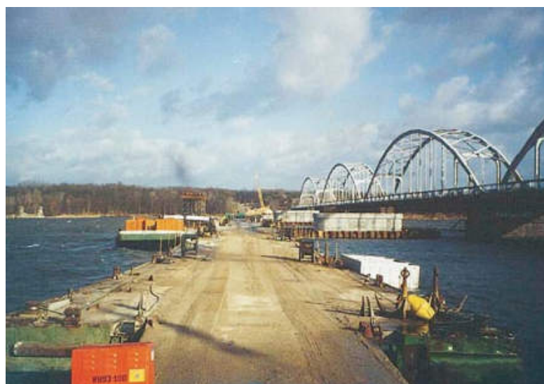
Dojazd do podpór pośrednich mostem pływającym

Wykonanie pozostałych robót związanych z budową filarów zaprojektowano w sposób tradycyjny.