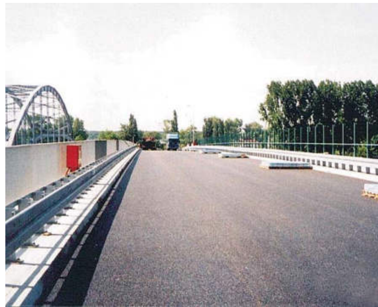
Roboty wykończeniowe na moście; elementy ekranów dźwiękochłonnych przygotowane do montażu

Montaż konstrukcji na budowie rozpoczęto w listopadzie 2001 r. Długotrwałe zamarznięcie Zalewu spowodowało że wysuwanie konstrukcji rozpoczęto w marcu; zakończono je w lipcu 2002 r. Płytę współpracującą wykonano od sierpnia do października 2002 r., w listopadzie ułożono część izolacji i ustawiono krawężniki granitowe. Roboty wykończeniowe wykonano w II kwartale 2003 r. Most otwarto dla ruchu 16 czerwca 2003 r.