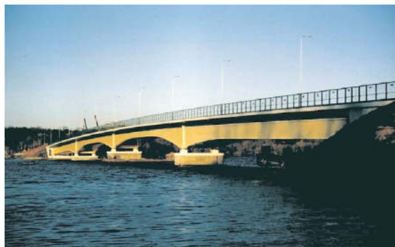
Widok zbudowanego mostu

Podpory mostu w formie masywnych przyczółków i filarów żelbetowych posadowiono na 52 palach wierconych średnicy 1500 mm. Pod przyczółkami nr 1 i nr 5 jest po 10 pali długości 14,5 m, pod filarami nr 2 i nr 3 po 10 pali długości odpowiednio 15,0 i 19,0 m, a pod filarem nr 4–12 pali długości 22,0 m.