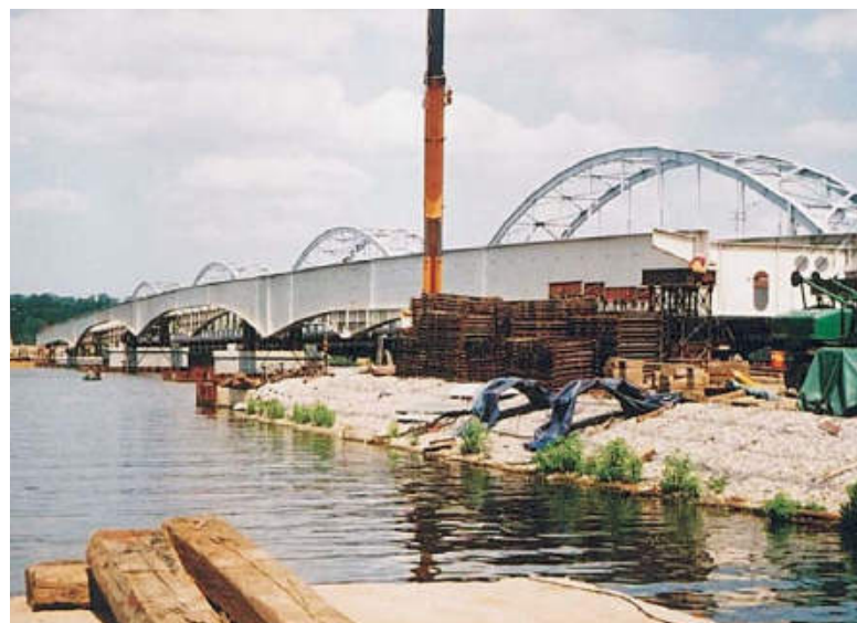
Konstrukcja nasunięta na podpory

Trudny problem prowadzenia barki podczas nasuwania (zmienne prądy wody i wiejące wiatry) rozwiązano za pomocą specjalnego olinowania (systemu wybieranych i luzowanych cum).