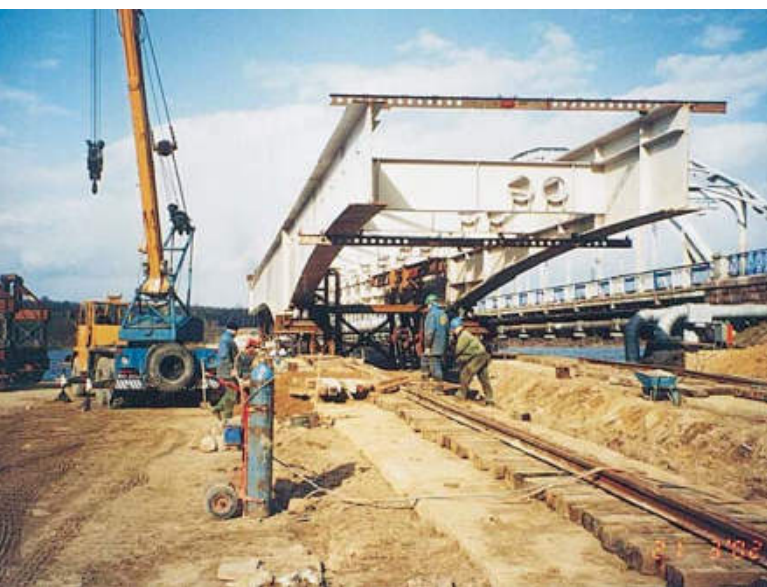
Montaż konstrukcji stalowej na brzegu

Po trzecie, z uwagi na ograniczoną długość placu scalania i istniejącą w tym rejonie czynną komorę rurociągu tłoczego ścieków miejskich, niezbędne było opracowanie odpowiedniego fazowania scalania części wyjściowej, uwzględniającego wielkość dostarczanych na budowę elementów montażowych i stateczność konstrukcji w każdym etapie nasuwki. Zastosowano etapowanie robót, obejmujące podniesienie scalonej części konstrukcji w położenie równoległe do projektowanej osi nasuwania podłużnego i najechnięcie z nią w pozycję pozwalającą na podstawienie barki prowadzącej.