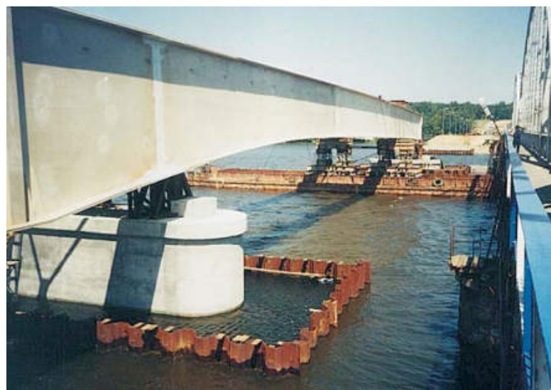
Nasuwanie konstrukcji za pomocą podpory pływającej

W celu uzyskania potrzebnej do nasuwania siły zaprojektowano system pras hydraulicznych przelotowych, kotwionych do zabudowy podpory nr 1 (przyczółka od strony Zegrza). Prasy i ich obsługę zapewniała firma BBR Polska.