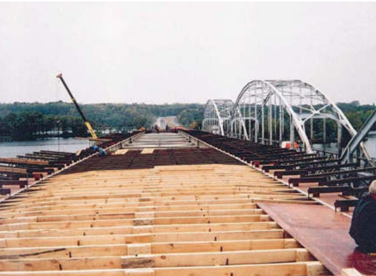
Konstrukcja wsporcza dla wykonania deskowania płyty pomostu

Wobec naglących terminów w III kwartale 2002 r., realizację płyty postanowiono przyspieszyć wykonując deskowanie od razu na całości konstrukcji. Deskowanie było podwieszane do pasów górnych konstrukcji stalowej za pośrednictwem stojaków stalowych traconych, spawanych do górnej powierzchni pasa co 1,50 m. Stojak na obu końcach miał przyspawane nakrętki do ściągów deskowaniowych \varnothing 20 mm, które podtrzymywały ruszt stalowy wewnętrzny między dźwigarami, z 2 \times 2 [100 wzdłuż i I 200 poprzecznie co 50 cm i zewnętrzny z elementów kratowych mostu składanego typu 22–80.