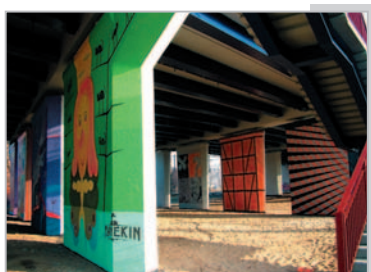
Estakada w ciągu ul. Kościuszki w Toruniu Andrzej Marecki – godło IL PONTE 04