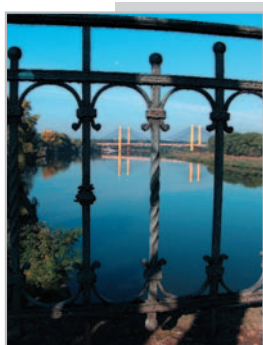
Widok mostu Milenijnego we Wrocławiu z mostu kolejowego Władysław Kluczewski – godło WUKA