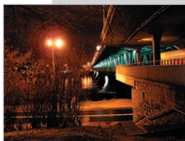
Most Gdański w Warszawie, widok z prawego brzegu rzeki Andrzej Stańczyk – godło „Światła mojego miasta 6/6”