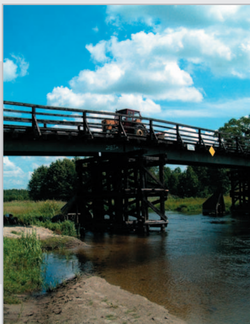
Wyróżnienie – Jadwiga Wrzesińska Most przez rzekę Pisę

Andrzej Niemierko, Instytut Badawczy Dróg i Mostów