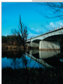
Most przez Narew w Nowogrodzie w południe Jadwiga Wrzesińska – godło BRZOZA 1