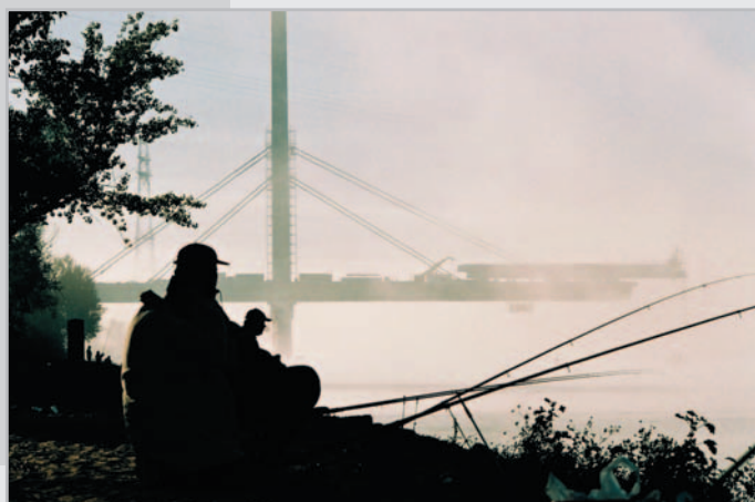
Wyróżnienie – Andrzej Berger Nowo budowany most przez Wisłę w Płocku