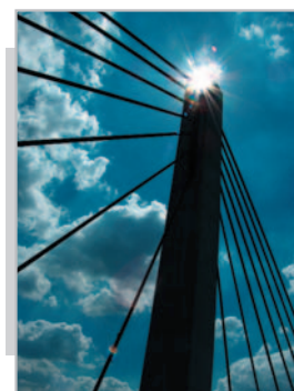
Świeca słońca na pylonie 10 podpory mostu Milenijnego we Wrocławiu Władysław Kluczewski – godło WUKA