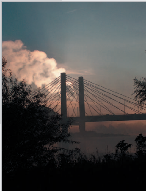
I nagroda – Władysław Kluczewski Pylon 10 podpory mostu Milenijnego we Wrocławiu o wschodzie słońca