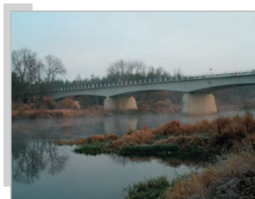
Most przez Narew w Nowogrodzie raniem Jadwiga Wrzesińska – godło BRZOZA 3