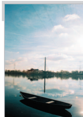
Nowo budowany most podwieszony w Płocku Andrzej Berger – godło ALPINISTA