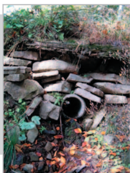
Przepust pod drogą na Klimczok w Szczyrku Jadwiga Wrzesińska – godło KLIMCZOK