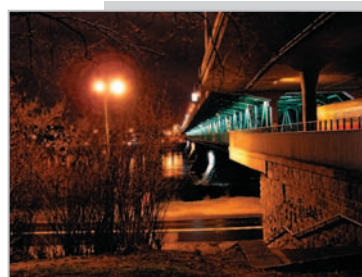
Most Gdański w Warszawie, widok z prawego brzegu rzeki Andrzej Stańczyk – godło „Światła mojego miasta 6/6”