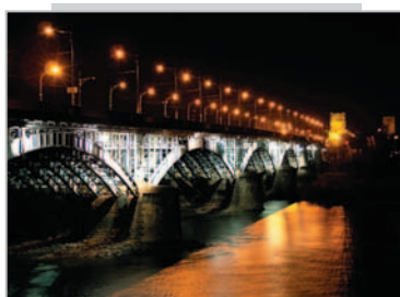
Most im. ks. Józefa Poniatowskiego w Warszawie Andrzej Marecki – godło IL PONTE 04