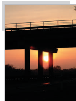
Wiadukt nad drogą Warszawa-Kraków w Grojcu o świcie Jadwiga Wrzesińska – godło GRÓJEC 2